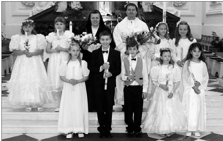
1. sv. přijímání ve Slavkově u Brna 3. června 2007

Římskokatolická farnost Slavkov u Brna, Malinovského 2, 684 01 Slavkov u Brna rkf.slavkov@biskupstvi.cz • Internetové stránky farnosti: www.farnostslavkov.cz