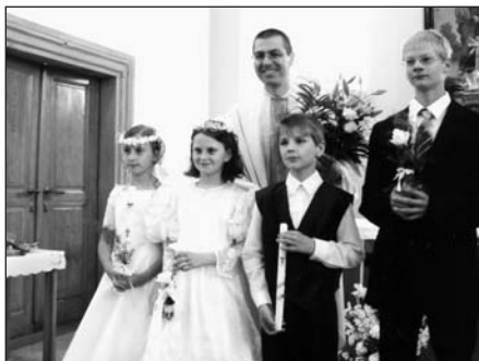
I. sv. přijímání v Heršpicích a v Hodějčicích 3. června 2007