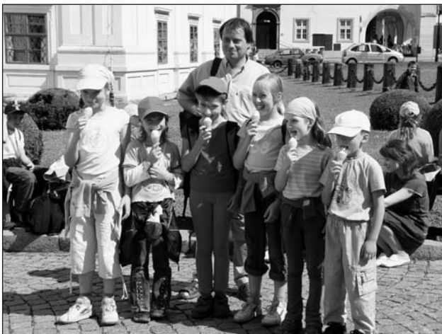
Farní výlet dětí do Kroměříže 26. června 2007