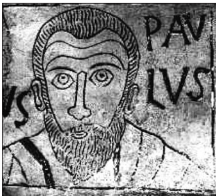
Nejstarší vyobrazení apoštola Pavla, rytina na náhrobním kameni (kolem roku 330), Řím (Vatikánská muzea)

U příležitosti dvou tisíce let narození apoštola Pavla, které historici kladou mezi léta 7 a 10 po Kristu, svatý otec Benedikt XVI. při nešporách slavnosti sv. Petra a Pavla (28. 6. 2007) v bazilice sv. Pavla za hradbami oficiálně oznámil, že mu bude věnován zvláštní jubilejní rok od 28. června 2008 do 29. června 2009. Tento „Rok sv. Pavla“ se koná nejen v Římě, kde jsou pod oltářem výše zmíněné baziliky uchovávány ostatky apoštola Pavla, nýbrž ve všech částech světa se pořádá celá řada liturgických a kulturních akcí, mnohá studijní symposia a rozličné pastorační iniciativy, které se nechávají inspirovat pavlovskou spiritualitou. Školní rok 2007-2008, jenž právě začíná, nabízí příležitost hlouběji poznat apoštola Pavla. Není nikdo, kdo by mohl zprostředkovat tak autentický pohled do prvotního křesťanství, jako právě apoštol Pavel. V jeho listech zaznívá bezprostřední hlas apoštola, který náležel k druhé generaci křesťanů. On byl povolán samotným vzkříšeným Kristem (srov. Gal 1,1), avšak nepatřil do kruhu dvanácti apoštolů (srov. Sk 1,13.26; 1 Kor 15,5-9). Jeho listy nám poskytují náhled do prvních pohanokřesťanských církevních obcí, do jejich struktury a organizace, do jejich problémů a potřeb, avšak rovněž i do debat a kontroverzí, které vyvstaly při volném přijímání pohanů do církve, která ještě platila za část židovského společenství. V svých listech dává Pavel najevo, kým skutečně je: