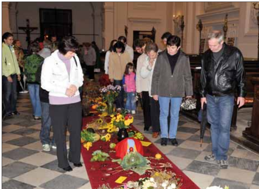
Poděkování za úrodu na téma citátů z Bible, říjen 2010