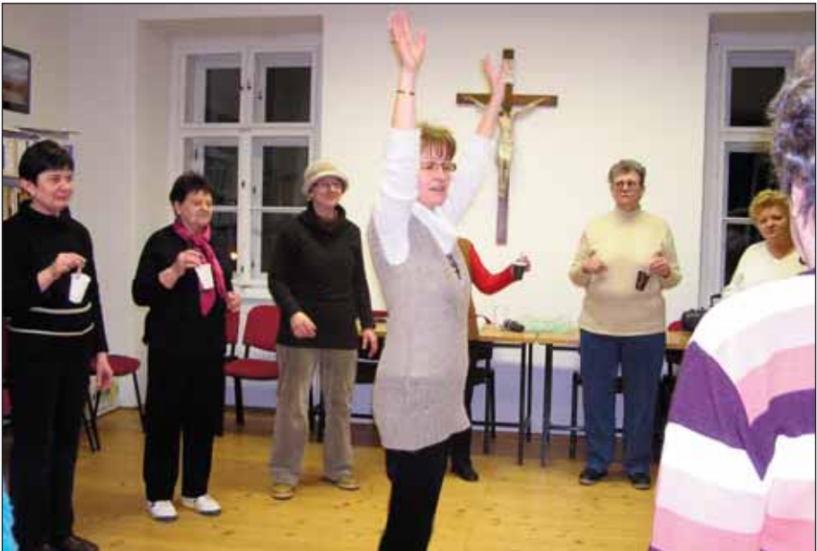
Ze setkání Klubu aktivních seniorů KLAS

Nadešel čas, začíná KLAS, co nám dnes přinese, čím zase novým potěší nás, na to se těší snad každá z nás.