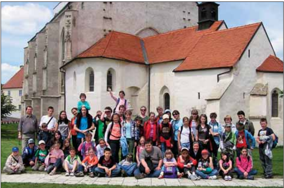
Výlet dětí z náboženství do Znojma v červnu 2010 (před kostelem v Hnánicích)