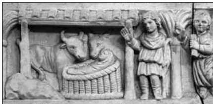
Sarkofág sv. Krispiny ze 4. století

Nejstarší vyobrazení „jesliček“ zřetelně poukazuje na tajemství Vánoc. Narození Božího Syna je podrobeno přirozeným nezbytnostem. Nemůže si vybrat čas a nemůže vyčkat na lepší situaci. Tohoto Spasitele a Pána nelze nalézt v královském