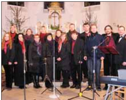
Komorní pěvecký sbor DANIELIS