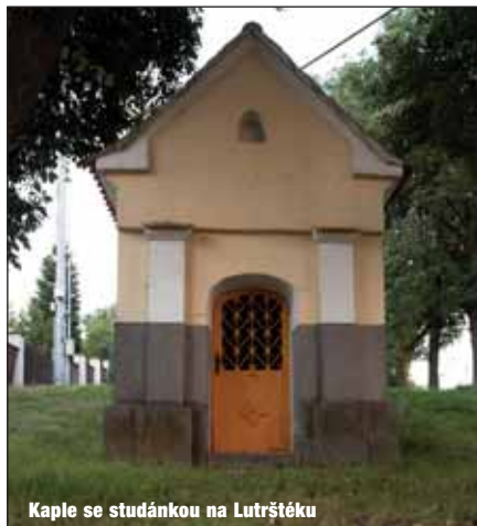
Kaple se studánkou na Lutrštěku