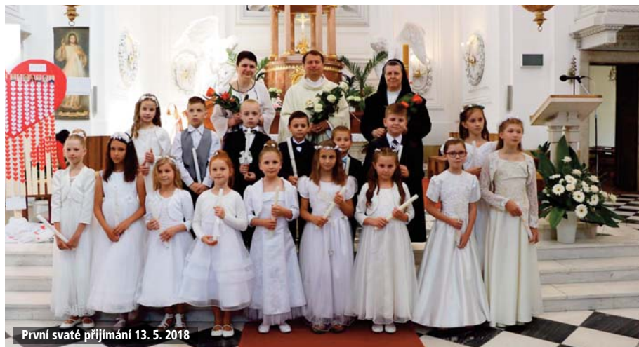
První svatě přijímání 13. 5. 2018